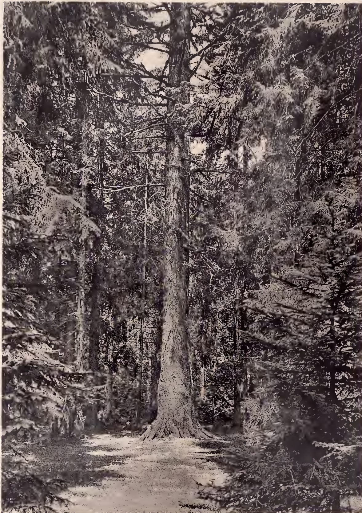
Lichtdruck: Polygraphisches Institut A.-G., Zürich